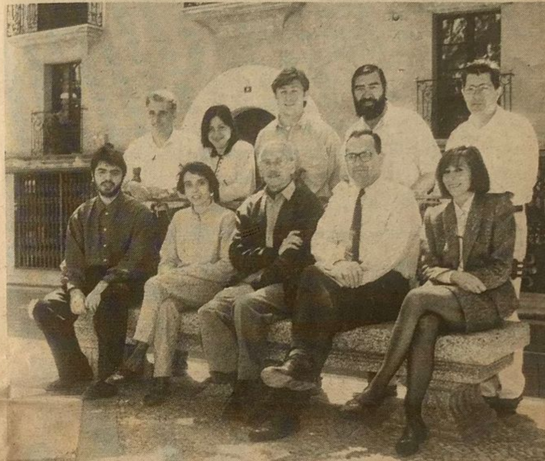
Aquests son els teus primers candidats a Cort. Amb el PSM, entra a l'Ajuntament